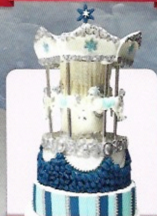
Tutoriel Gâteau Carrousel d'Hiver