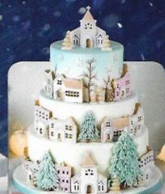
Tutoriel Gâteau Village en Pain d'Épices